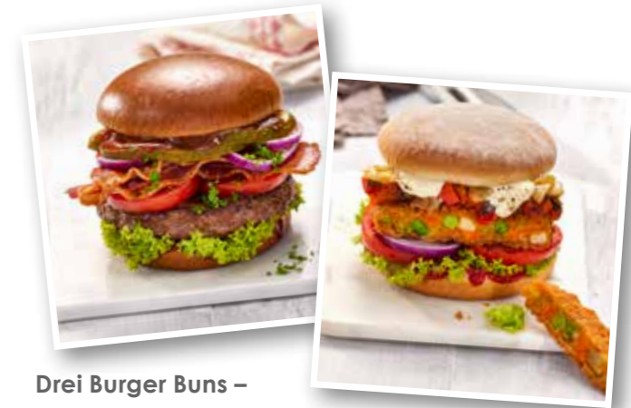
Drei Burger Buns – passend für jedes Konzept

Knusprig und geschmackvoll – die ideale Ergänzung für mehr Volumen im Burger oder als würziges Topping für Fries. Natürlich auch einfach pur als leckerer Snack ein Genuss!