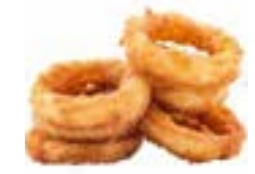
Leckere Verführer: Sriracha Onion Ring

Knusprig und geschmackvoll – die ideale Ergänzung für mehr Volumen im Burger oder als würziges Topping für Fries. Natürlich auch einfach pur als leckerer Snack ein Genuss!