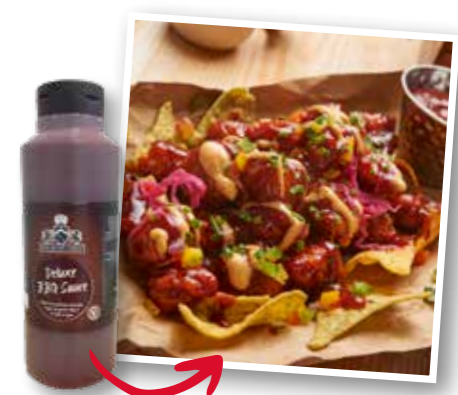
Erst die Sauce macht den Burger perfekt!

Damit Sie es einfach haben, bieten wir drei verschiedene Buns in unserem Sortiment – perfekt abgestimmt auf die Größe unserer Burger. Ob klassisch mit einem Brioche-Bun oder passend für bewussten Genuss in der Vollkornvariante – unsere Buns überzeugen im Geschmack!